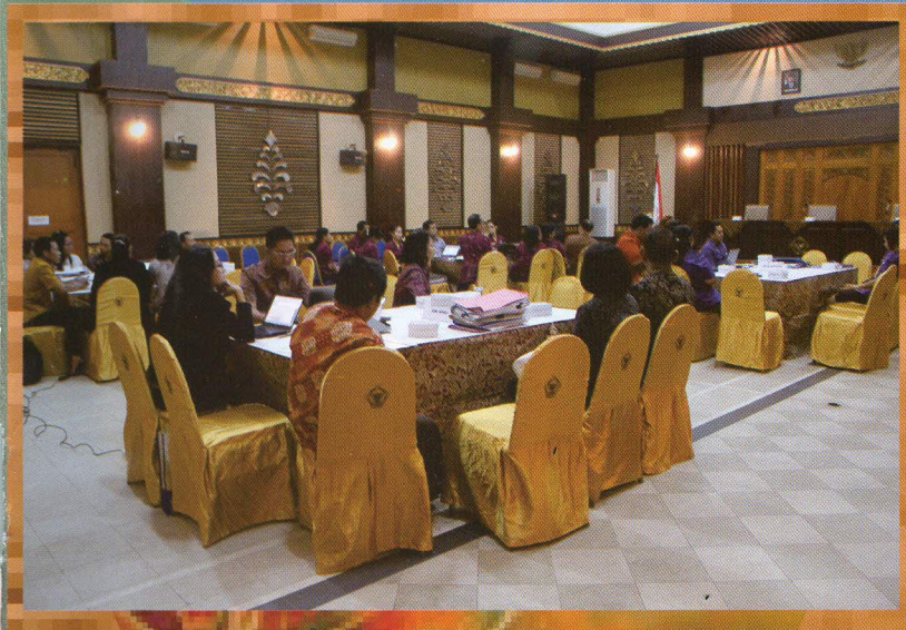
Denpasar, Agustus 2013

Bertempat di auditorium kantor perwakilan, BPK RI Perwakilan Provinsi Bali melaksanakan Pembahasan Tindak Lanjut Hasil Pemeriksaan dengan Pemerintah Daerah se-Provinsi Bali. Berdasarkan Undang-Undang Nomor 15 tahun 2004 pasal 20 disebutkan bahwa setiap pejabat wajib menindaklanjuti rekomendasi Laporan Hasil Pemeriksaan (LHP) BPK RI. Sebagai proses