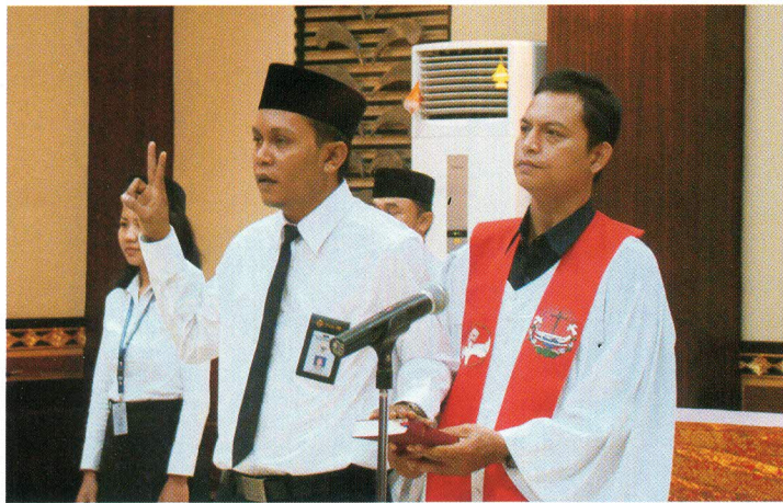
Salah seorang CPNS yang diambil sumpah/janjinya didampingi rohaniwan