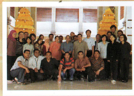
Kepala Perwakilan Provinsi Bali beserta para peserta Konsinyering berfoto bersama