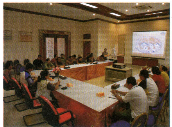
Pemaparan seputar kepariwisataan oleh Dinas Pariwisata Provinsi Bali

Disamping menjelaskan visi dan misi kepariwisataan Bali juga menyampaikan kondisi kepariwisataan Bali dan permasalahan permasalahannya. Acara tersebut berlangsung cukup hangat dan diakhiri dengan sesi tanya jawab.