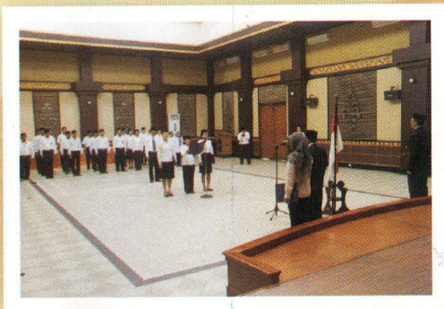
Kepala Sekretariat Perwakilan Provinsi Bali selaku inspektur upacara pada hari Kesaktian Pancasila beberapa waktu yang lalu