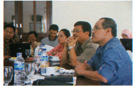
Kepala Perwakilan Provinsi Bali didampingi Kepala Sekretariat saat memimpin rapat di bedugul

masing-masing Sub Bagian yang langsung dilanjutkan dengan pembahasan/diskusi. Pada pleno akhir, disimpulkan adanya beberapa revisi, diantaranya pada Belanja Bahan di Sub Bagian Keuangan dan Sekretariat Kalan, serta Belanja Modal di Sub Bagian Umum. Revisi tersebut diharapkan agar dapat diusulkan ke Biro Keuangan BPK RI di Jakarta.