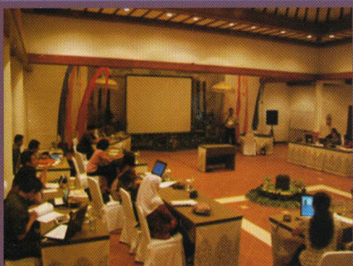
Suasana saat diskusi pembahasan Laporan Hasil Pemeriksaan atas Manajemen Aset Tetap dan PDAM pada Perwakilan Provinsi Bali.