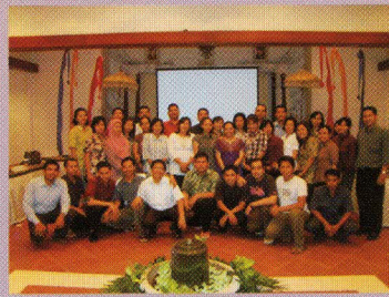
Foto bersama para peserta diskusi pembahasan Laporan Hasil Pemeriksaan (LHP) atas manajemen aset tetap dan Perusahaan Daerah Air Minum di Hotel Santika, Kuta, Badung