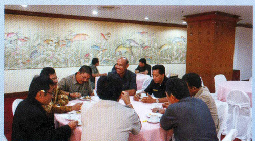
Pertemuan Anggota VI BPK RI dengan Pemda se-Bali, NTB, NTT bertempat di Inna Grand Bali Beach, Sanur pada tanggal 22 Feb 2010