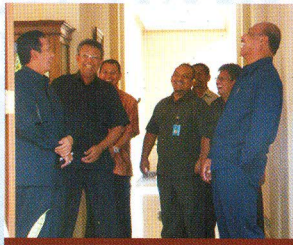
Ramah tamah Anggota I BPK RI dengan Kakan dan Pejabat Struktural Perwakilan Prov. Bali pada acara kunjungan kerja pada tanggal 08 Maret 2010