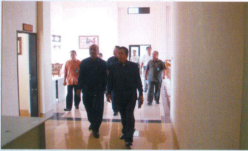
Peninjauan kantor oleh Anggota I BPK RI dalam rangka kunjungan kerja ke Kantor Perwakilan Provinsi Bali pada tanggal 8 Maret 2010