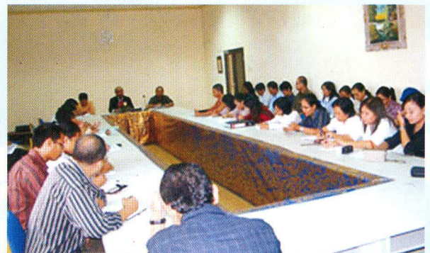
Pengarahan Kepala Perwakilan di Ruang Belajar Lantai 3 Kantor Perwakilan Provinsi Bali pada 31 Maret 2010

“Dalam melakukan pemeriksaan, auditor harus memperhatikan kode etik BPK karena temuan pemeriksaan yang berimplikasi aspek hukum dan telah dirilis dalam LHP, akan terbuka lebar untuk disomasi atau digugat pihak lain,” ujar Kepala Perwakilan dalam pengarahan di Ruang Belajar, Kantor Perwakilan Provinsi Bali. Selain memberikan pengarahan, Kepala Perwakilan juga memaparkan hasil Rakor Jakarta pada 17 – 19 Maret 2010 lalu, yang antara lain mengenai upah pungut dan insentif dalam Pendapatan Daerah, Dana Dekonsentrasi, fee PT. BPD dan beberapa isu lain.