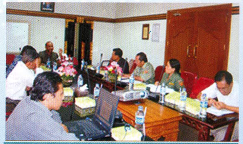
Pembahasan Tindak Lanjut dengan Pemda Tabanan di ruang rapat kantor Perwakilan Provinsi Bali pada tanggal 12 April 2010