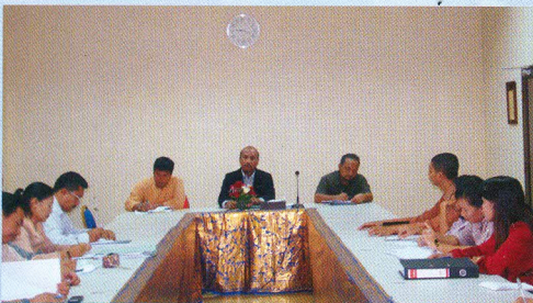
Kakan Provinsi Bali memberikan pengarahan sebelum Auditor melakukan pemeriksaan LKPD TA. 2009 pada tanggal 31 Maret 2010