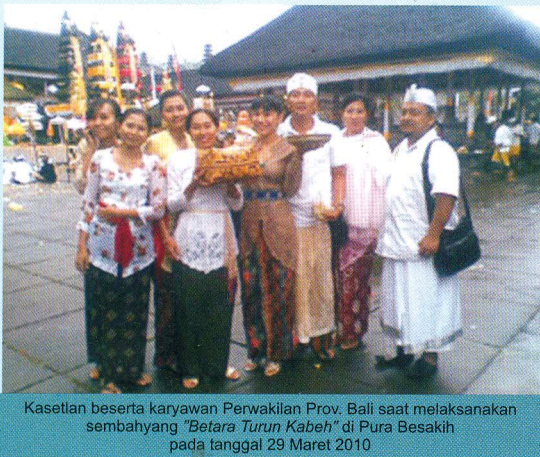
Kasetlan beserta karyawan Perwakilan Prov. Bali saat melaksanakan sembahyang "Betara Turun Kabeh" di Pura Besakih pada tanggal 29 Maret 2010